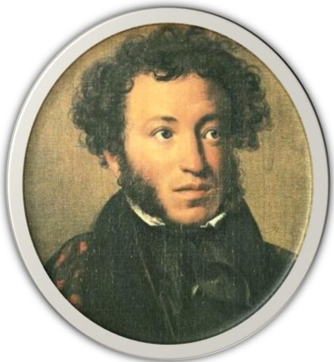
Alexander Sergejevič Puškin

Vždy bude platiť pravda trpká, v tom jednom nezmení sa svet, učených hárba, múdrych kôpka, neznámych jak maku, druha niet.